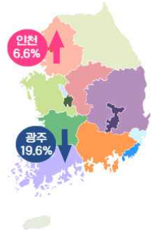
【 지역별 증감 현황 】