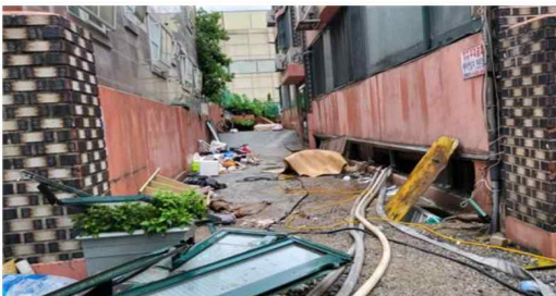
간밤 폭우로 서울 관악구에서는 지난 8일 오후 9시 7분께 침수로 반지하에 3명이 갇혀 신고 했지만 결국 사망했다. 사진은 사고 현장.