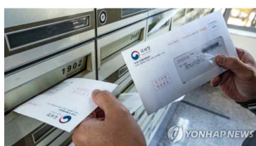
(서울=연합뉴스) 항공모 기자 = 23일 오후 서울 송파구의 한 아파트의 우편함에 국세청에서 발송한 2022년 주택분 종합부동산세 고지서가 도착해 있다.

종합부동산세 고지서 각 가정에 도착 입력 2022.11.23. 오후 2:50 수정 2022.11.23. 오후 2:50