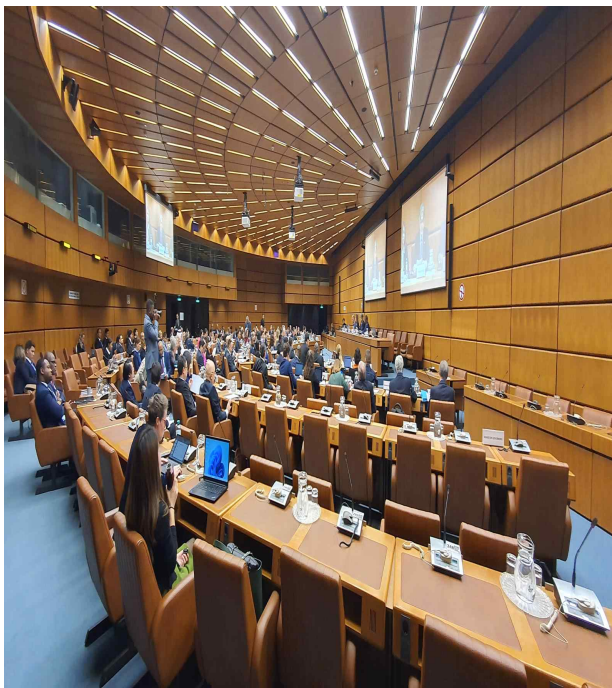
<제 12 차 IACA 당사국 총회>